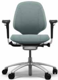
RH MERO 200 SILVER

RH Mereo 200 hat eine halbhohle Rückenlehne und verfügt standardmäßig über Rollen für Teppichböden und ein Fußkreuz in grau lackiertem Aluminium. Sie können das Modell auch mit Armlehnen ergänzen.