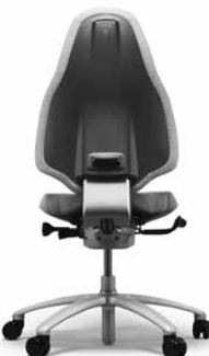
RH MERO 220 SILVER

RH Mereo 220 hat eine hohe Rückenlehne und verfügt standardmäßig über Rollen für Teppichböden und ein Fußkreuz in schwarz lackiertem Aluminium. Als Extra-Ausstattung stehen unter anderem eine Nackenstütze, Armlehnen und ein Kleiderhaken zur Verfügung.