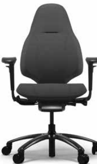
RH MERO 220 BLACK

RH Mereo 200 hat eine halbhohle Rückenlehne und verfügt standardmäßig über Rollen für Teppichböden und ein Fußkreuz in schwarz lackiertem Aluminium. Sie können das Modell auch mit Armlehnen ergänzen.