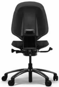
RH MERO 200 BLACK

RH Mereo 200 hat eine halbhohle Rückenlehne und verfügt standardmäßig über Rollen für Teppichböden und ein Fußkreuz in grau lackiertem Aluminium. Sie können das Modell auch mit Armlehnen ergänzen.